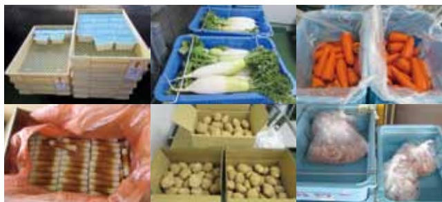
▲高騰している給食材料

A 国の交付金を活用し、給食費材料における物価高騰分の公費負担および無償化を実施したが、単独では大きな財政負担となる。令和5年度予算では、子育て世帯の経済的負担を軽減するため、給食費の値上げをしないように高騰分を公費負担として予算計上している。