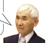
日本共産党議員団 梶田 進