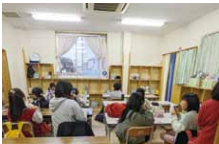
▲富貴児童クラブの様子

A 共働き家庭などの小学生を放課後児童支援員が預かる事業で、利用者は年々増加傾向にある。その対応策として、富貴、衣浦両児童クラブの定員増を予定している。 また、地域の方々の協力が得られれば、ボランティアによる活動を取り入れて