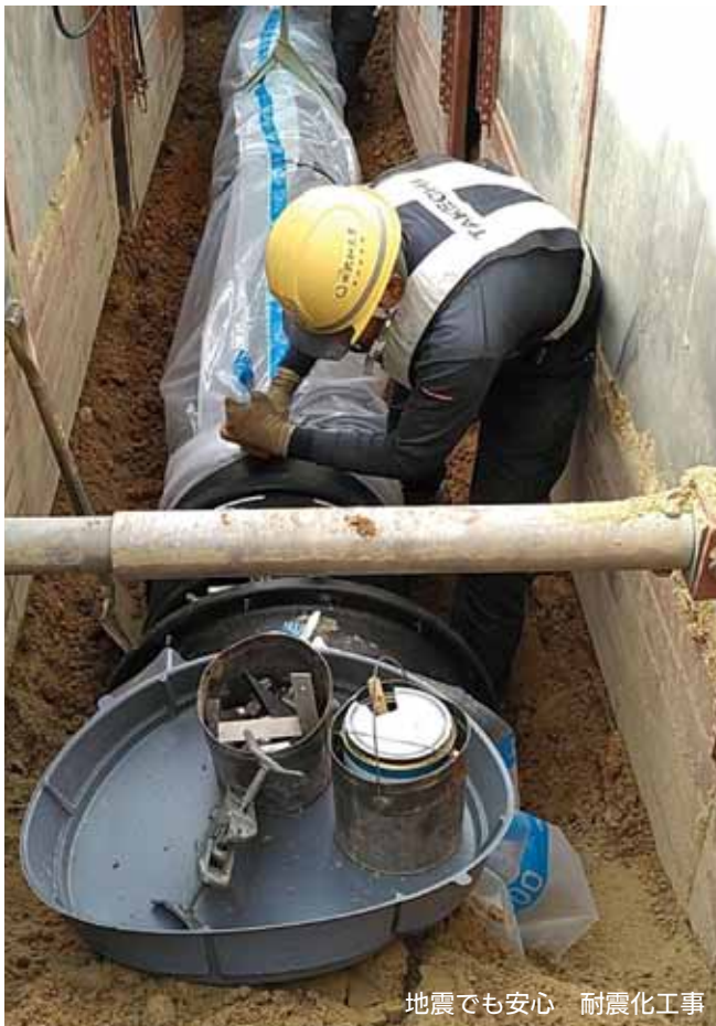
地震でも安心 耐震化工事