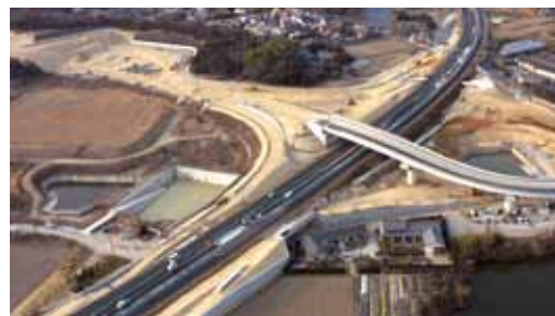
▲ IC 南側より一部

A ・町北部地域をはじめ、本町全体において広域交通の利便性が向上する。 ・インターチェンジ周辺地域のポテンシャルが高まることで、都市的土地利用等につながる可能性が高まる。 ・インターチェンジ周辺地域だけでなく、接続する幹