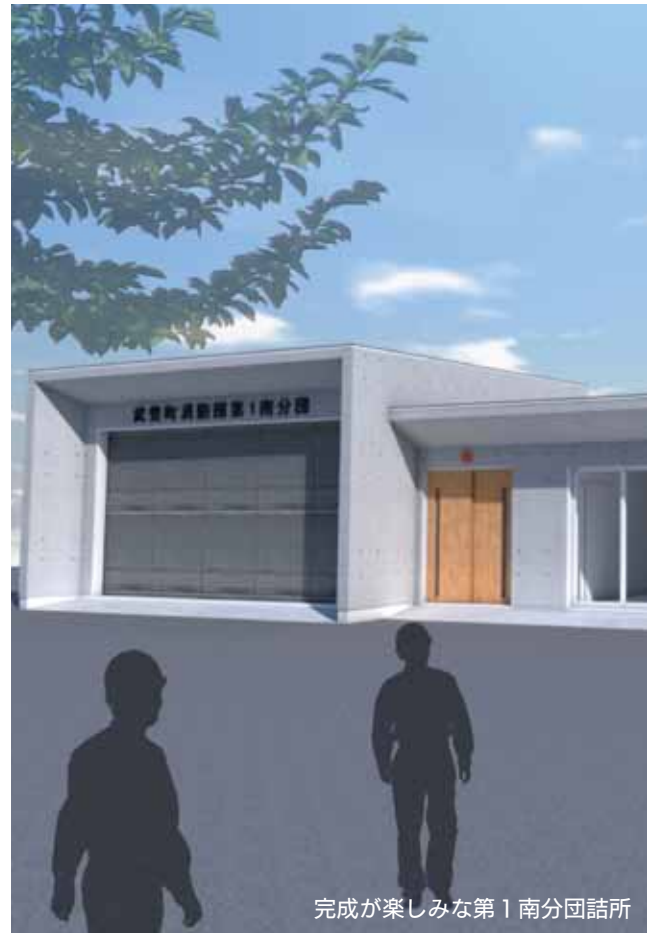
完成が楽しみな第1南分団詰所