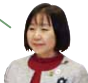
公明党議員団 甲斐百合子