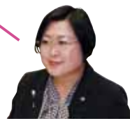
公明党議員団 鳥居 美和

認知症に伴う行方不明を防ぎ、安心して暮らせる地域づくりは重要なまちづくりのひとつ！