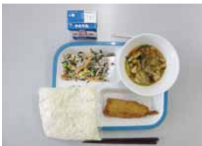
▲武豊たまりを使ったきしめん

A 子育て世帯の負担軽減を図るため、令和5年度の学校給食の材料費の価格上昇分は、町の負担にて、対応する。