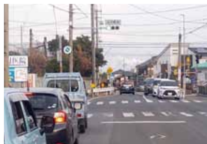
▲渋滞時の名鉄上ヶ駅周辺

A 武豊町で鉄道高架事業を実施する場合、愛知県が事業主体となり実施することになる。