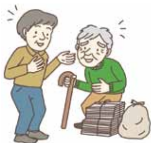
▲ 地域で助け合おう

今後、本町の実情に適した、ごみの収集体制について、先進自治体の状況も合わせ、調査研究していく。