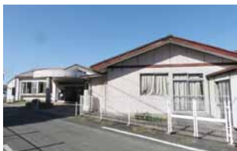
▲整備が望まれる多賀授産所

A 必要に応じて、ホームヘルパーによる家事援助や入浴・排泄・食事介助。住宅改修の費用助成。相談支援専門員が希望や状況に適した支援につなげていく。