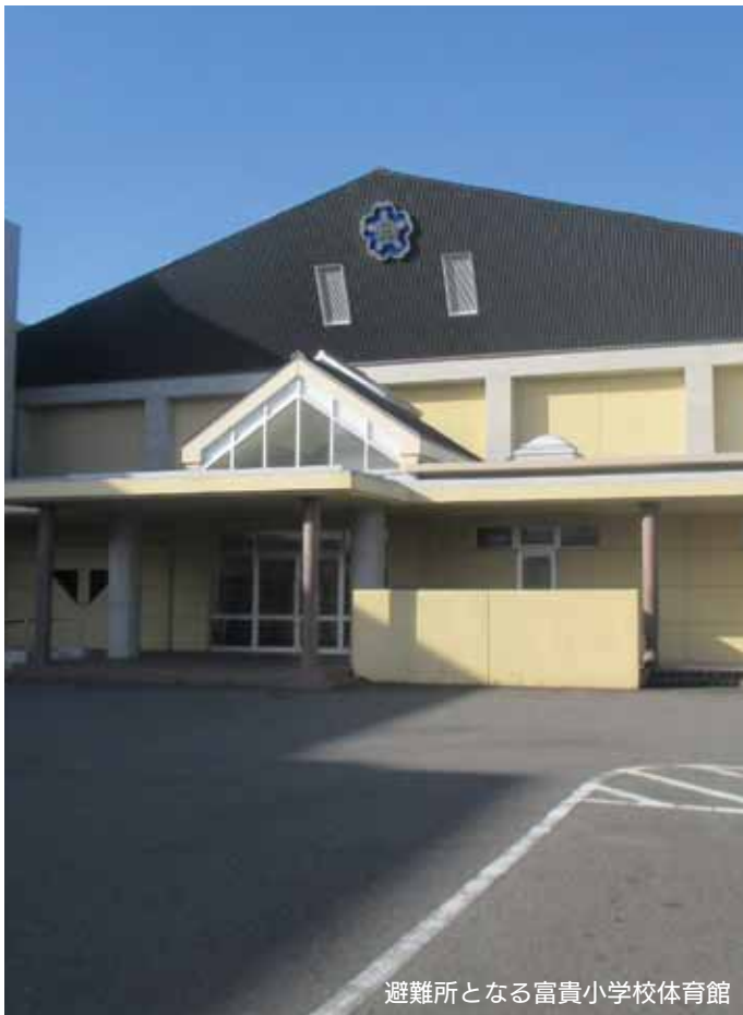
避難所となる富貴小学校体育館